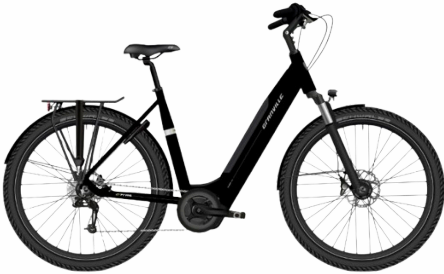
E-TRAIL BLACK GLOSS